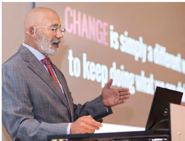
PulPaper 2018