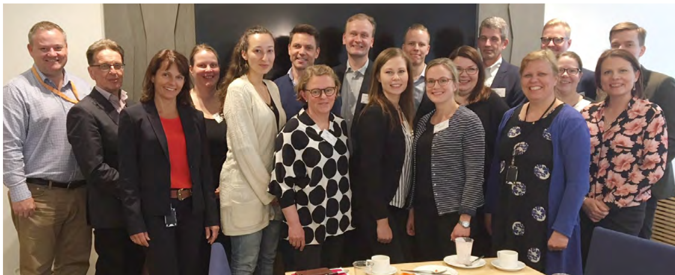
Mentorointiohjelman 2017-2018 osallistujia päätöspalaverissa Metsä Groupin pääkonttorilla.

päätetyssä projektissa oli mukana kaikkiaan 14 paria ja saman verran pareja aloitti syyskuussa 2018 uudessa, lukuvuoden mittaisessa mentorointiprojektissa syyskuun lopulla. Syksyllä alkaneeseen projektiin saatiin runsaasti ilmoittautumisia mentoreiksi niin suoraan jäsenistöstä kuin osaamistoimikunnan ja hallituksen aktiivisen rekrytointityön tuloksena. Osa mentorihalukkaista jäi jopa reserviin seuraavia kierroksia silmällä pitäen.