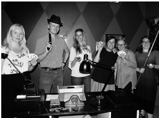
PI:n tiimi vaarallisissa kesäjuhlatunnelmissa kesäkuussa 2018.