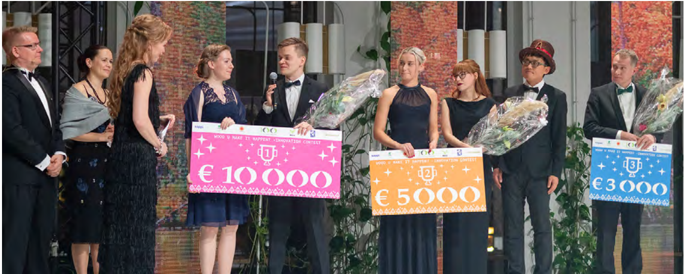
Innovaatiokilpailun voittajat Metsäteollisuus ry:n 100-vuotisjuhlassa Finlandiatalolla 4.12.2018.