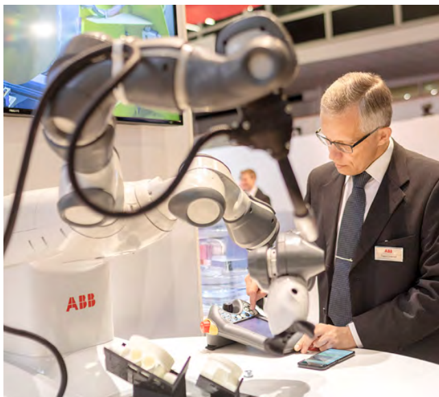
PulPaper 2018