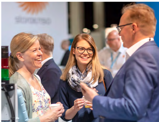
Kuva: Messukeskus, PulPaper 2018